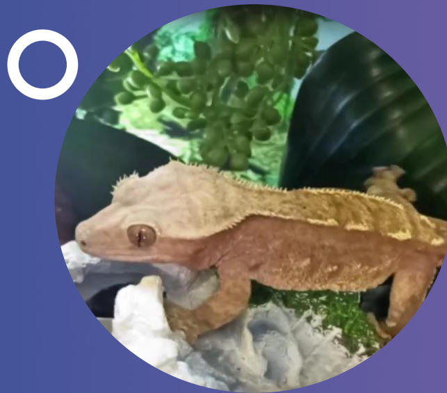
Как удержаться за молекулы