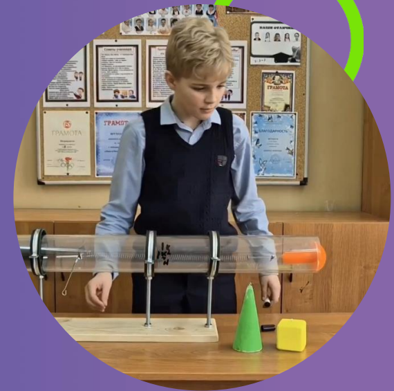
Зачем автомобилю аэродинамика?